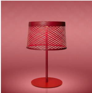
Twiggy Grid XL