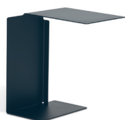
DIANA B 2002