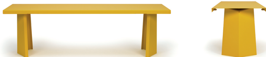
Honiggelb honey yellow

Acero, microestructura de laca pulverizada. Versión para exteriores: galvanizada, microestructura de laca pulverizada resistente a la intemperie, Detalles y colores ver lista de precios.