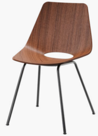
S 661 FORMHOLZSCHALE IN NUSSBAUM, GESTELL STAHLROHR PULVERBESCHICHTET/ MOLDED PLYWOOD SHELL IN WALNUT, FRAME TUBULAR STEEL POWDER-COATED