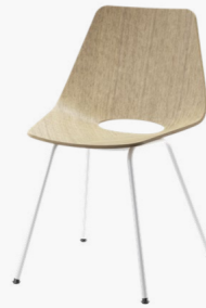
S 661 FORMHOLZSCHALE IN EICHE, GESTELL STAHLROHR PULVERBESCHICHTET/ MOLDED PLYWOOD SHELL IN OAK, FRAME TUBULAR STEEL POWDER-COATED