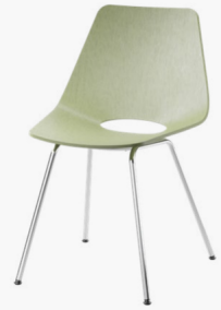
S 661 FORMHOLZSCHALE IN BUCHE GEBEIZT, GESTELL STAHLROHR VERCHROMT/ MOLDED PLYWOOD SHELL IN BEECH STAINED, FRAME TUBULAR STEEL CHROME-PLATED